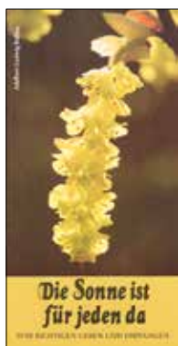
Die Sonne ist für jeden da