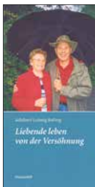
Liebende leben von der Versöhnung