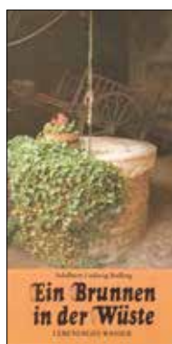
Ein Brunnen in der Wüste