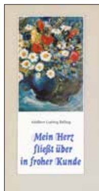
Mein Herz fließt über in froher Kunde